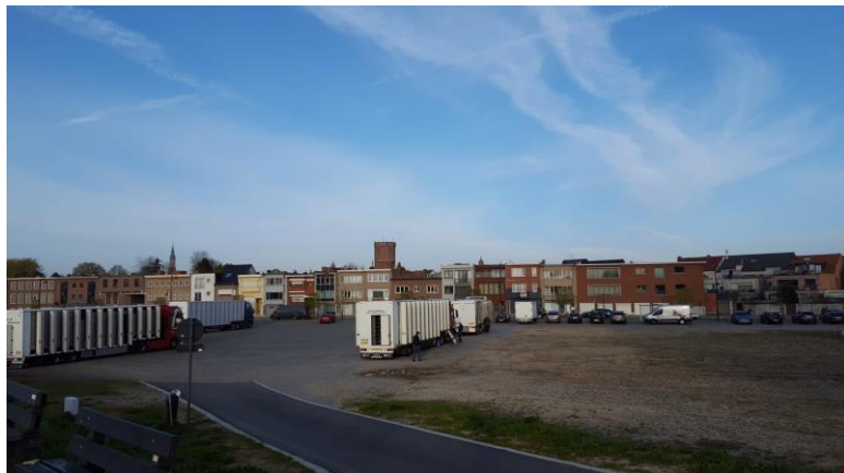
LOSSINGSPLAATS DUFFEL 24-4-2021